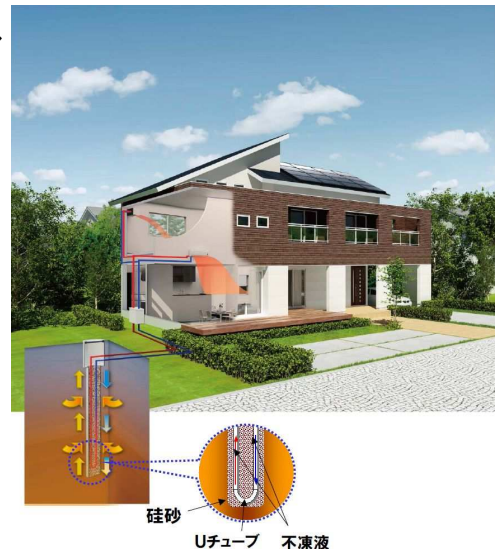
《地中熱住宅イメージ図》

「地中熱住宅」が実現する快適で“少”エネな住まいを皆様に体感して頂きたく、秋の「地中熱住宅フェア」では、期間中、ご成約いただき、地中熱住宅のモニターにご協力頂ける方には、新生活にピッタリの素敵なモニター特典をご用意しております。