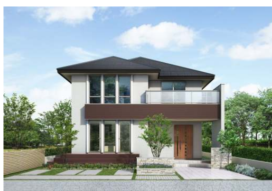
②外観スタイル:オーセンティック ※部分共有二世帯タイプ