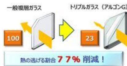
【図2】一般複層ガラスと「トリプルガラス」の断熱性能比較