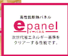
《「閉じる技術」・eパネル》