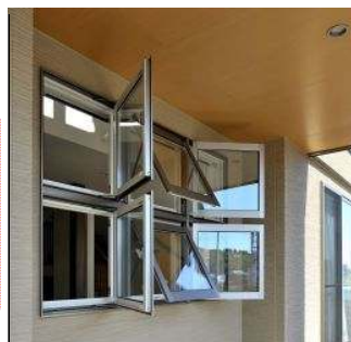
《「開ける技術」・フル3D ウィンドウ》