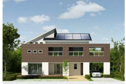
《独創的な外観デザイン》