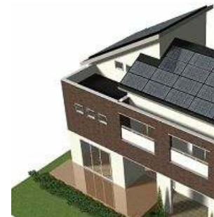
《「遮る技術」・深い軒の出》