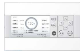
《モニタリングシステム》