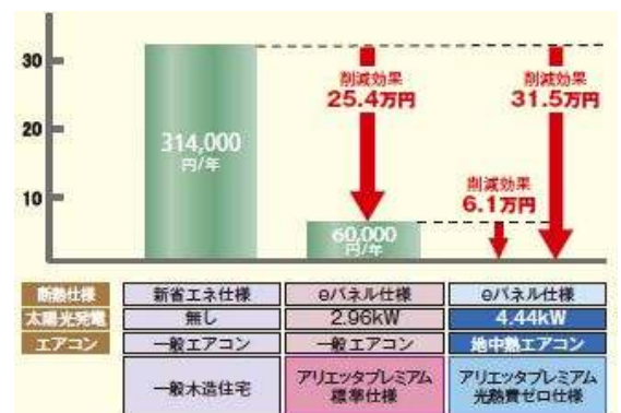
《一般住宅とeパネル住宅 (標準・光熱費ゼロ仕様)との光熱費比較》 ※当社シミュレーション結果より