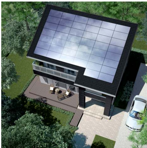
《太陽光発電システム 搭載イメージ》