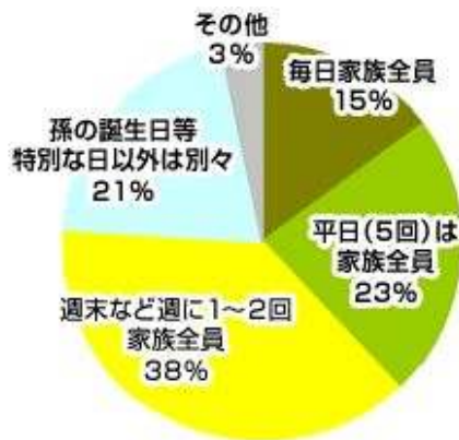
■現在単世帯の方の理想(n=121)