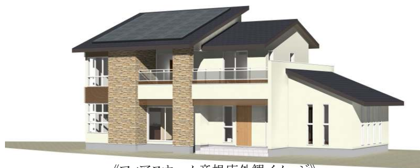
《ファイアスホーム彦根店外観イメージ》

今回の新モデルハウスは、滋賀県で“初めて”となるファイアスホームの新商品『アリエッタ～風と光を奏でる家～』のモデルハウスとなっております。東日本大震災以降、住宅の耐震性能やエコ・節電の取組みが叫ばれておりますが、ファイアスホームでは性能表示制度の耐震等級で最高ランクの等級3相当を実現する高強度の構造体『eパネル』に制震システムを搭載した『粘震+eパネル』を開発。さらに、太陽光発電システムや地中熱を利用した空調システムなど、エネルギーを作り出す「創エネ」の取組みを進め、さらに暮らしの中でエネルギーの使用を少なくする「少エネ」を追求した先進の住まいを提案しています