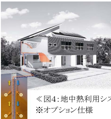
《図4:地中熱利用システム イメージ》 ※オプション仕様

太陽光以外の再生可能エネルギーとしてご提案するのが“地中熱”の利用。地中の温度は外気に対して温度変化が極めて少なく、一年を通して約15℃を保っています。『地中熱利用システム』(図4)は、「夏は冷たく、冬は暖かい」地中熱を利用した空調システムです。地中熱を利用することにより、一般のエアコンと比較して、少ないエネルギーで冷暖房が可能です。