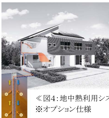
《図4:地中熱利用システム イメージ》 ※オプション仕様

太陽光以外の再生可能エネルギーとしてご提案するのが“地中熱”の利用。地中の温度は外気に対して温度変化が極めて少なく、一年を通して約15℃を保っています。『地中熱利用システム』(図4)は、「夏は冷たく、冬は暖かい」地中熱を利用した空調システムです。地中熱を利用することにより、一般のエアコンと比較して、少ないエネルギーで冷暖房が可能です。