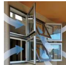
《図3:フル3D ウィンドウ イメージ》

気温の変化の大きい夏と冬は高気密・高断熱性能が力を発揮。季節の良い春と秋は『フル3Dウィンドウ』(図3)で効率的に風の流れを創出したり、南側に『深い軒の出』を設けるなど自然の風を効果的に採り込み、少ないエネルギーで生活する工夫を盛り込んでいます。