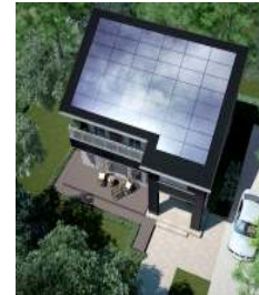
《図1:太陽光発電システム》

末永くエコロジーであるためには、自らが電気を創る太陽光発電システムは標準装備でなくてはならないと考えます。(図1)電気をすべて買う暮らしから、自分の家で電気を創り、余った電気を電力会社に売るゆとりある生活が可能です。また、停電・災害時にも電気を使用可能になります。さらには、「見える化」の工夫として省エネナビを設置し、住まい手の省エネ意識を啓発します。