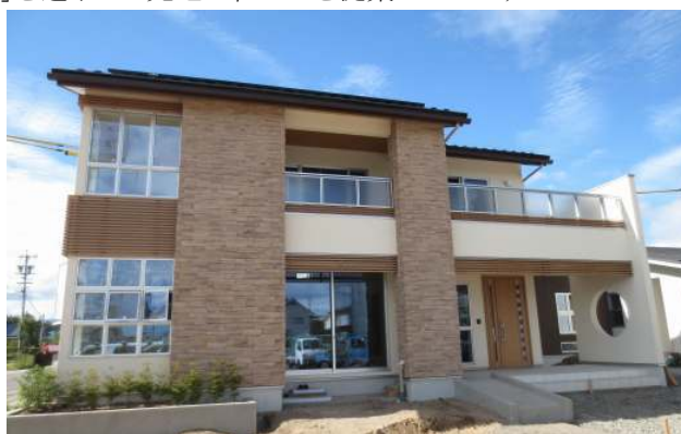
《ファイアスホーム佐久平店 外観写真》

今回の新モデルハウスは、長野県で“初めて”となるファイアスホームの新商品『アリエッタ～風と光を奏でる家～』のモデルハウスとなっております。東日本大震災以降、住宅の耐震性能やエコ・節電の取組みに注目が集まっていますが、ファイアスホームでは性能表示制度の耐震等級で最高ランクの等級3相当を実現する高強度の構造体『eパネル』に制震システムを搭載した『粘震+eパネル』を開発。さらに、太陽光発電システムや地中熱を利用した空調システムなど、エネルギーを作り出す「創エネ」の取組みを進め、さらに暮らしの中でエネルギーの使用を少なくする「少エネ」を追求した先進の住まいを提案しています