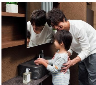
(中)家の中に菌やウイルスを持ち込まない「エントランス手洗い」