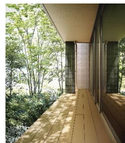
自然の恵みを活用した パッシブデザイン

平屋ならではの大きな勾配天井と吹抜けは、土間とつながる横方向の広がりに加え、縦方向にも伸びやかな空間を創出し、リビングダイニングキッチンに開放感を生み出します。広々とした一つながりの空間でも高断熱であたたかく、家族が集ってくつろげる暮らしを提案します。