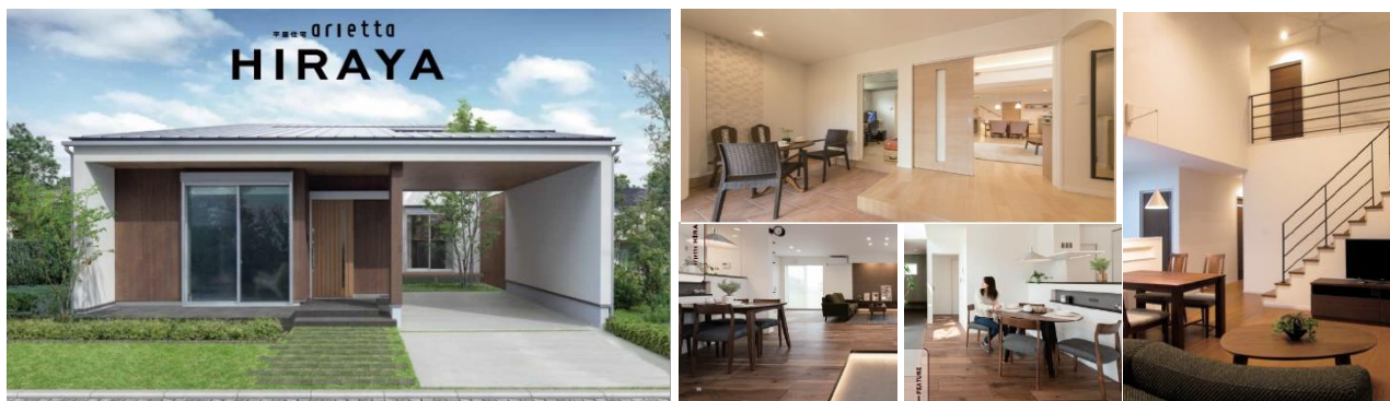
『arietta HIRAYA』 外観・内観イメージ

株式会社LIXIL住宅研究所フィアスホームカンパニーは、主力商品であるarietta(アリエッタ)に、土間や中庭で内と外を快適につなぐ平屋住宅『arietta HIRAYA』を新たに加え、2020年7月23日(木・祝)より発売します。