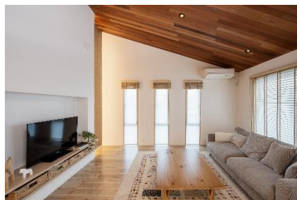
(右)伸びやかな空間を創出する「勾配天井」