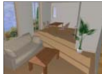
光のシミュレーション

「光」を取り入れた設計 ：リビングへの採光を遮らない格子状の「グレーチングバルコニー」や南面リビング・ダイニングには高さのある大開口サッシを設定し、多くの光を取り込む事で「快適性の追求」と無駄な人工照明の点灯を極力減らし「エネルギー消費の削減」を狙います。また、地域により、日射遮蔽策としてエコガラスを装備しています。