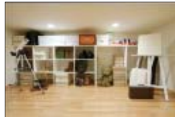
リビング・コンテナ

家族が集まるリビングに出し入れし易い大収納「 リビング・コンテナ 」を設置することで、すっきりした空間を実現しています。また、高気密・高断熱技術を活かしたワンルームタイプのLDKは、2階のプライベートゾーンと吹き抜けでつなげて大空間にすることで、常に家族間のコミュニケーションがとれるように設計にしています。