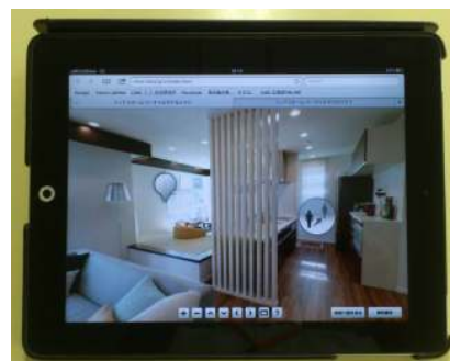
《iPadでのバーチャルモデルルーム》

今回公開した『バーチャルモデルルーム』は、フィアスホームの最新住宅「アリエッタ」をベースにしています。モデルハウス内の特長を紹介しながら、1階～2階と人の目線と同じ高さでモデルハウス内部をご覧頂くことができ、実際のモデルハウスに会場した感覚でご覧いただけるものとなっております。また、モデルハウス内の各特長については、ポップアップウィンドウをご用意。例えば、「収納に困るものがある」との声に対しての提案である「リビングコンテナ収納」やベビーカーや趣味の道具を置くことが出来、快適に使える提案「通り土間玄関」など様々な機能・使い方を紹介しています。今後もお客様の住宅検討の一助となる情報提供に努めてまいります。