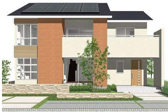
■フィアスホーム「Newアリエッタ」の外観イメージ■

フィアスホームが運営する住宅サイト「おうち＊くらぶ」におけるミセスに対するアンケート調査では、76%ものミセスが「日常の家事に負担を感じている」というアンケート結果が出ていることから、フィアスホームでは、今回、“家事がスマートに出来、いつまでもキレイがつづく、ストレスフリーの家”をご提案する新商品『Newアリエッタ』～キレイがつづく家～を開発し、発売することとなりました。