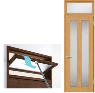
写真1:ランマ付き内部建具