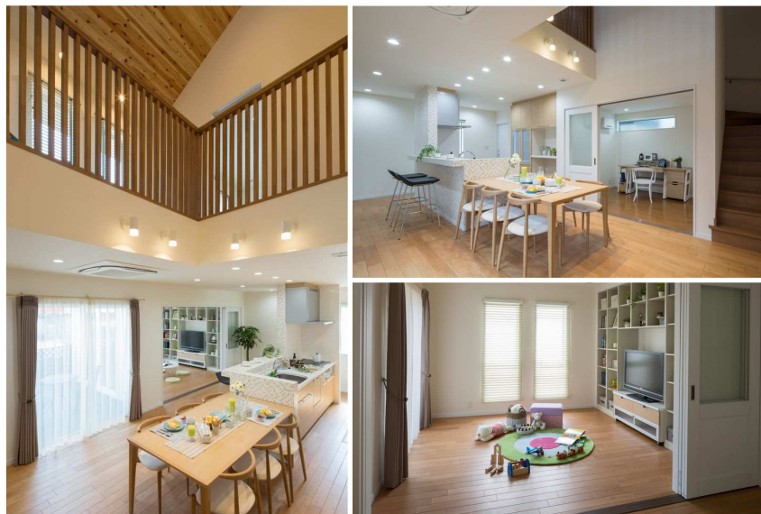
【新商品『アリエッタ』の特長を生かした間取り提案例】

【その他】フィアスホームは注文住宅となりますが、Q値 1.6W/㎡・K をクリアしている 33坪~43坪の企画プランを 10プランご用意しています。