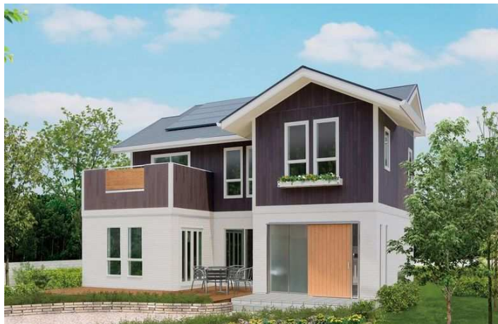
〈新商品「アリエッタ」外観イメージ〉

株式会社LIXIL住宅研究所 フィアスホームカンパニー(住所:東京都江東区亀戸 1-5-7/ プレジデント:近藤正司)は、このたび、北海道基準を上回る断熱性能Q値1.6W/m 2 ・K以下の高断熱性能と『健康』を考えたコンセプトホームのDNAを盛り込んだ新商品『アリエッタ』を7月12日(土)より発売します。これにあわせて高性能住宅には欠かせない太陽光発電をお得に設置出来る『太陽光発電 実質負担0円キャンペーン』を同日より開催します。