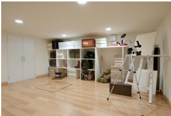
<写真1:リビングコンテナ>