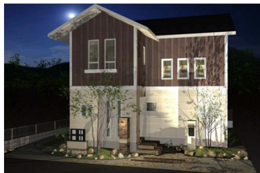
フィアスホーム広島北店 春日野 THE TOP 住宅展示場 「アリエッタ」モデルハウス外観イメージ

(株)LIXIL住宅研究所 広報・宣伝部 担当:千明(ちぎら) 電話:03-5626-8251 メール:chigirak3@lixil-jk.co.jp フィアスホームホームページ/TOP URL: http://www.fiace.jp/