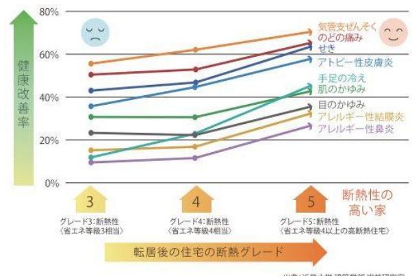
図2：住宅の高断熱化による健康改善効果