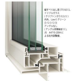
「トリプルガラス樹脂サッシ」 イメージ

窓は、断熱性能が高く安全なクリプトンガス入りの「トリプルガラス」と、樹脂フレームを使用した世界トップクラスの断熱サッシ「エルスターX」(LIXIL)を採用。