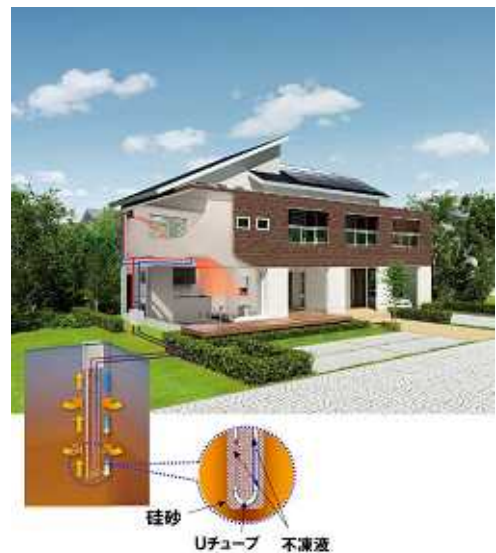
(地中熱住宅イメージ図)

「地中熱住宅 e-POWER」が実現する快適で“少”エネな住まいを皆様に体感して頂きたいと、新春“地中熱住宅”フェアでは、期間中ご成約いただき、地中熱住宅のモニターにご協力頂ける方には、新生活にピッタリの素敵なモニター特典をご用意しております。