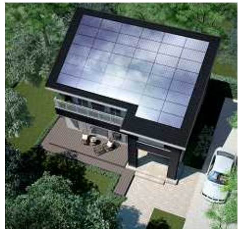
太陽光発電システム 搭載イメージ

“電気を創る”太陽光発電システムを標準採用。電気を全て買う暮らしから、自分の家で電気を創り、余った電気を電力会社に売るゆとりある生活を提案しています。