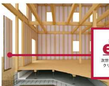
「閉じる技術」・eパネル