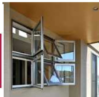
「開ける技術」・フル3D ウィンドウ