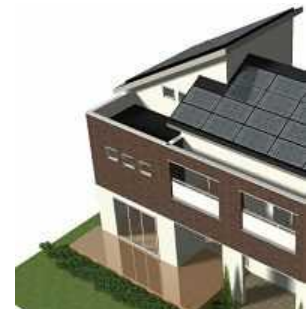
「遮る技術」・深い軒の出