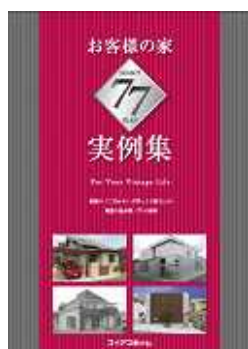
< 来場者特典 > お客様の家 実例集77

本件に関する報道関係者様からのお問い合わせは下記までお願いします。 (株)LIXIL住宅研究所 広報・宣伝室 広報担当 千明 E-Mail: chigirak3@tostemju-ken.co.jp 電話: 03 - 5626 - 8251 フィアスホームホームページ/TOP URL: http://www.fiace.jp/