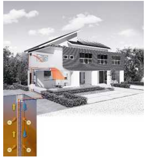
地中熱エアコン イメージ