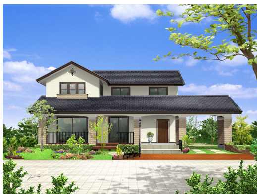
《フィアスホーム熊本南店モデルハウス外観イメージCG》

今回の新モデルハウスは、熊本県で“初めて”となるフィアスホームオリジナル高性能断熱材一体型パネル『eパネル住宅』を採用したモデルハウスとなっております。東日本大震災以降、エコや節電の取組みが叫ばれておりますが、フィアスホームでは『eパネル』を採用した住宅に、太陽光発電や地中熱利用システムと組み合わせることで、自然エネルギーを最大限に活用した“少”エネで快適な暮らしを提案しています。