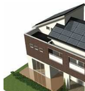
≪「遮る技術」 深い軒の出≫