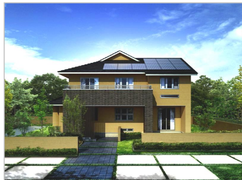
《和モダンデザイン》